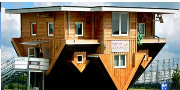
Team Andersom (burger)participatie 3.0

Helpt organisaties bij uitdagingen op gebied van participatie, klantgericht werken en samenwerken.